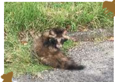
第10回最優秀賞「タヌキ？」